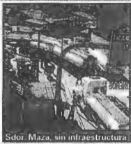
Sdoiir Maza, sin infraestructura

En la relación con Uruguay sigue latente el bloqueo de los accesos a los puentes en Gueleguaychí y Colón por el conflicto de las papeletas. La apertura del tránsito la semana última trae un poco de alivio, pero no previsibilidad. Semanas atrás, la Cámara del Autotransporte Terrestre Internacional del Uruguay (Catidu) reclamó al gobierno uruguayo que haga cumplir el ATTT y normalice los trámites bilaterales. "No es posible sostener con firmeza la vigencia del acuerdo que garantiza la libre circulación de bienes, servicios y factores productivos si en lugar de las autoridades legítimamente constituidas, debemos observar a actores públicos y privados, locales o provinciales, que a través de medidas de protesta o actitudes proteccionistas cuestionan un sistema institucional de transporte constituido desde hace más de cuarenta años", dice la carta.