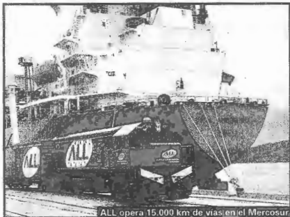
ALL opera 15.000 km de vías en el Mercosur