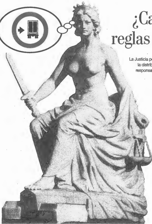
LA JUSTICIA, ESCULTURA EN MARMOL DE LOLA MORA (SAN SALVADOR DE JULIJA)