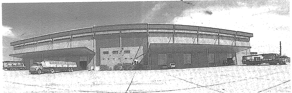
La ZAL, sede la muestra

El proyecto demandó una inversión de 40 millones de pesos y para una segunda etapa se estima construir otros 10.000 m 2 de depósito y oficinas. ●