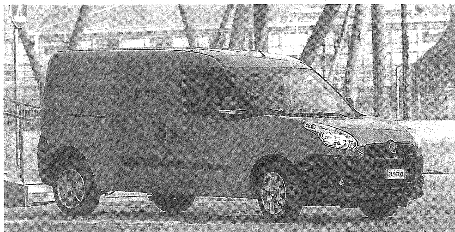
El recientemente lanzado Dobló Cargo, de Fiat