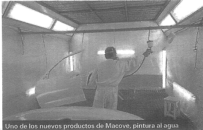
Uno de los nuevos productos de Macove, pintura al agua

Otro de los productos recién promocionados por la firma, es la pintura al agua para vehículos con la tecnología Envirobase High Performance . "Es una bicapa de agua que no usa disolventes ni diluyentes, por lo que no contamina el medio ambiente y es más seguro para el que está pintando", resaltó Colino. Esta pintura "es de fácil aplicación y es eficaz, porque proporciona el color perfecto en cada ocasión; es