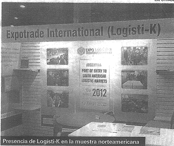
Presencia de Logisti-K en la muestra norteamericana

Fue el aumento que se registró en los Estados Unidos en cuanto a nuevos pedidos de equipamiento para la industria logística.