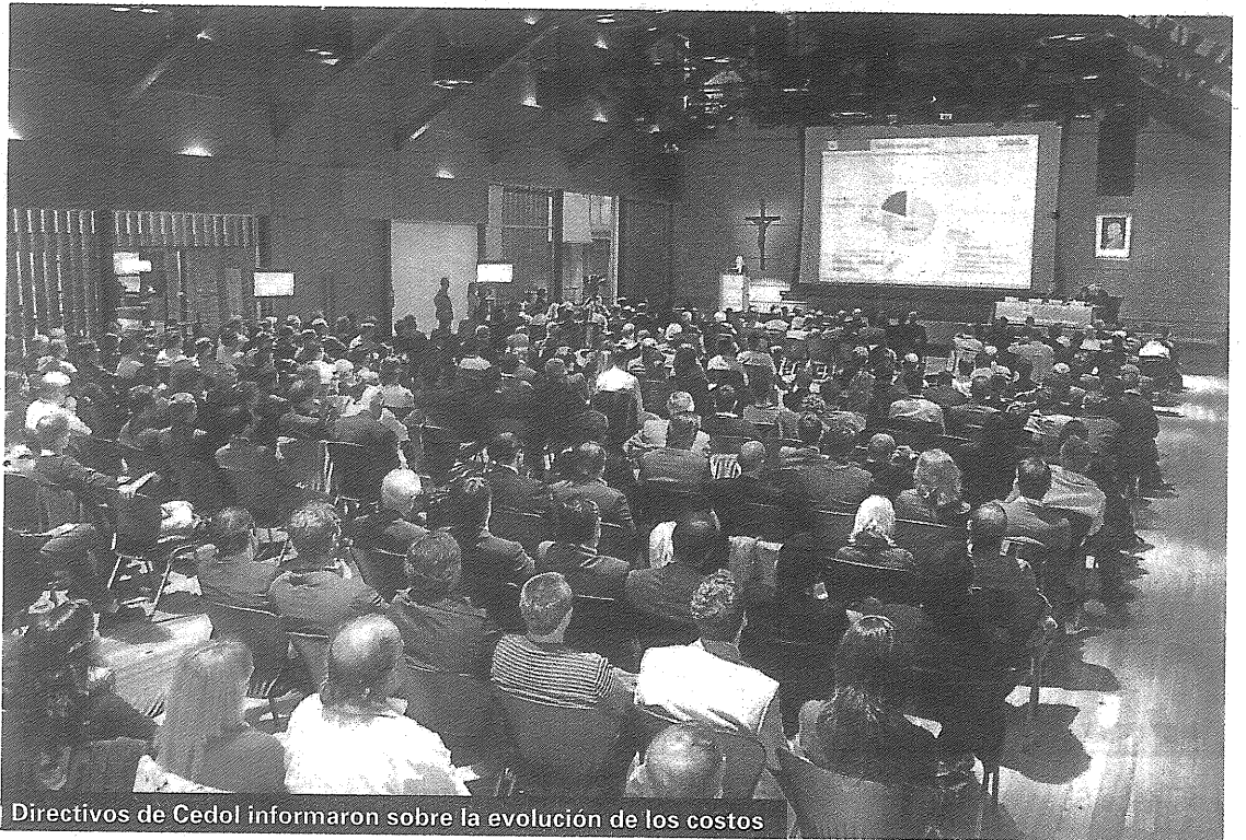
Directivos de Cedol informaron sobre la evolución de los costos

Otro de los rubros de peso en el indicador es el combustible, que el año pasado aumentó cerca del 19%, de acuerdo a estimaciones de la cámara. En la evolución de este ítem, un trabajo de la consultora abeceb.com informa que a partir de la obligación de cortar el gasoil con un 7% de biodiesel, los precios se encarecieron. En septiembre de 2010 el litro de biocombustible se pagaba $ 3,11 y pasó a $ 3,76 en