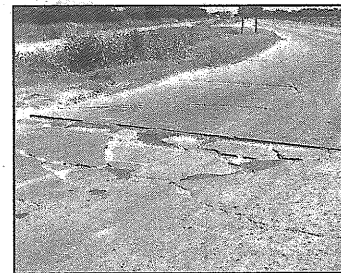
Baches en distintos puntos del trazado, signos del deterioro de la arteria