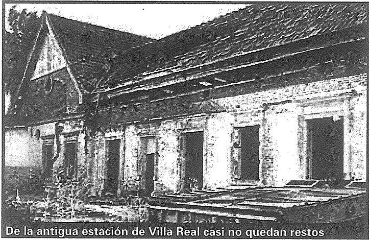
De la antigua estación de Villa Real casi no quedan restos