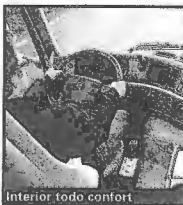
Interior todo confort