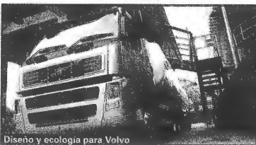
Diseño y ecología para Volvo