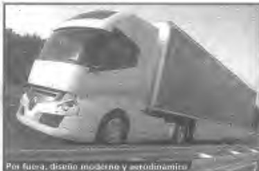
Por fuera, diseño moderna y aerodinámico

Elegancia, confort y eficiencia son las características de Radiance, el nuevo prototipo que la marca francesa presentó en el Salón de Hannover