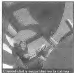
Comodidad y seguridad en la cabina

Renault Trucks presentó en el último Salón de Hannover el Radiance, un concept truck de líneas muy estilizadas y carácter innovador. Pero, ¿qué es un concept ? Son prototipos que las marcas fabrican con objetivos claros: resultan un ejercicio de nuevas ideas de diseño para utilizarlas en la evolución de modelos vigentes y, de paso, medir la reacción del público y la competencia.