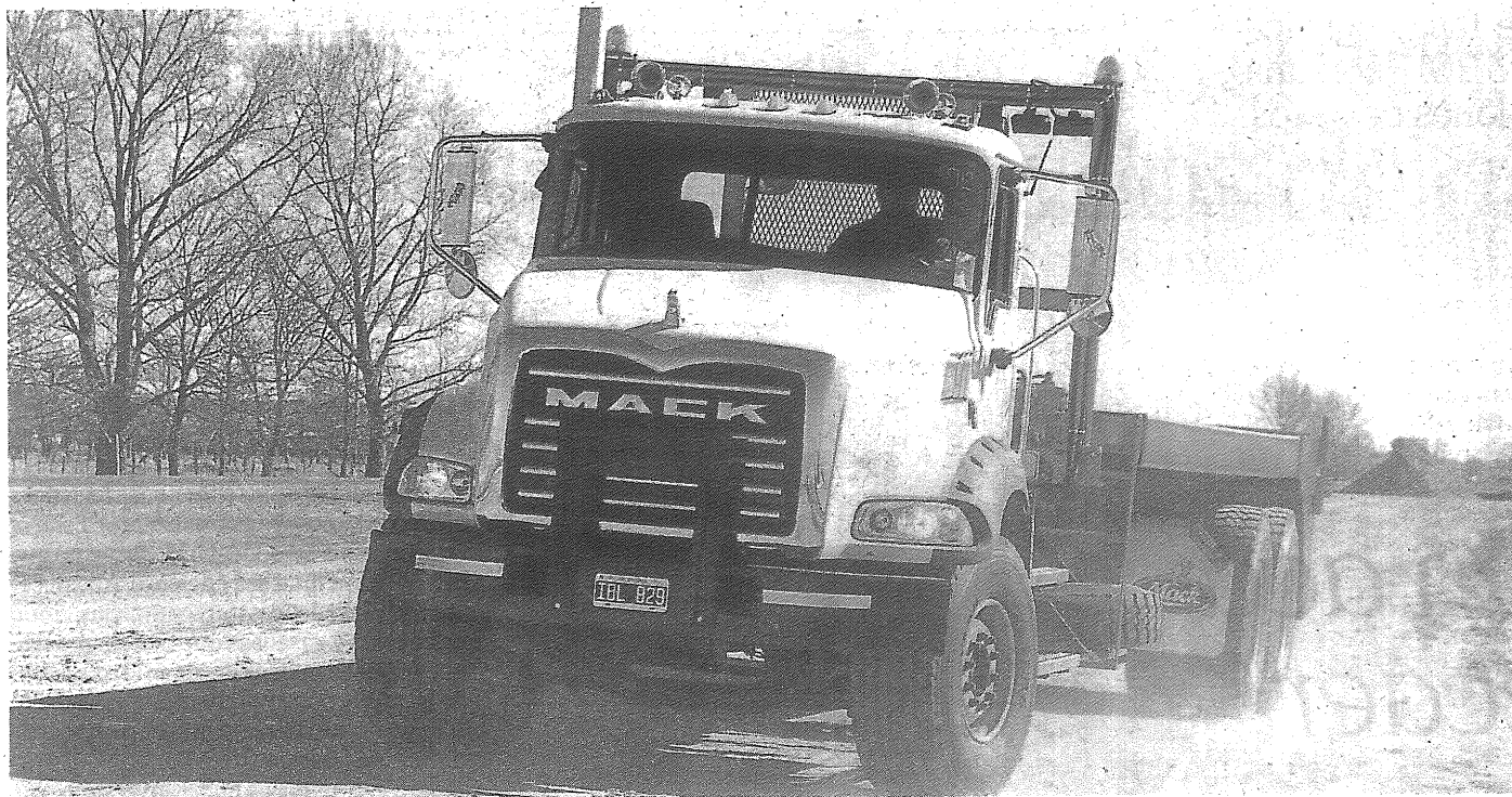
La automotriz tendrá un local en San Juan y analiza nuevas locaciones