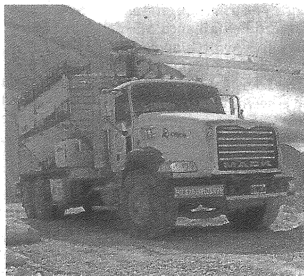
Especializados en minería

Además, remarcó que la empresa, fundada por su padre en 1947, "nació para prestar servicios y luego incorporó la venta de vehículos. Nosotros hacemos una proyección de cada unidad en función del mantenimiento de servicio y el desgaste que la unidad va sufriendo, con el objetivo de que el camión mantenga sus prestaciones a lo largo de toda su vida útil".