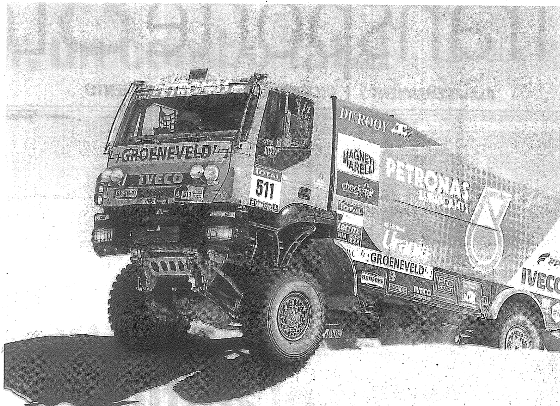
La automotriz Iveco estuvo presente en la prueba sudamericana

Goodyear fue reconocida por parte de Caterpillar, productor de equipos para minería y construcción, con el Premio Platino por "Excelencia en Calidad", la categoría más alta brindada por esta compañía. También la empresa fue premiada por MAN Latin America como el mejor proveedor en la categoría de Calidad de Producto. El reconocimiento realizado durante la ceremonia de los Supply Awards fue por la calidad de sus neumáticos para camión radial Serie 600.